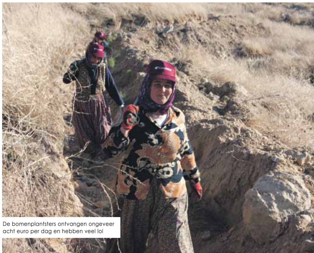
De bomenplantsters ontvangen ongeveer acht euro per dag en hebben veel lol

Nurgül Kasikci is de oprichtster van het interactieve weblog duurzaamheidskompas.nl. Hier wordt vanuit het consument- en perspectief informatie gegeven over ontwikkelingen en trends op het gebied van duurzaamheid. Op haar weblog legt Kasikci milieuvriendelijke en ecologisch verantwoorde producten en diensten langs de duurzame meetlat. Op verzoek kijkt ze kritisch naar het bomenproject van Corendon. ‘Als tour operator of vliegmaatschappij moet je niet zomaar bomen planten in verre landen om zo van je schuldgevoel af te komen. Samenwerking met de lokale bevolking is belangrijk. Het project moet voorzien in een behoefte die ook ter plekke van belang is. Zo wordt bij het Corendon-project afgestemd op de behoefte van de lokale bevolking, door bodemerrosie tegen te gaan. Dat klinkt als een goed begin.’ Volgens Kasikci laten steeds meer consumenten zich leiden door maatschappelijk verantwoord ondernemen en duurzaam toerisme, ‘maar ook hier geldt: het succes van een initiatief hangt af van de laagdrempeligheid voor de consument. De mogelijkheid om tijdens het aanschafproces van een vliegticket een boom te kopen, is een goed voorbeeld. De wereld wordt niet slechter van het planten van bomen.’